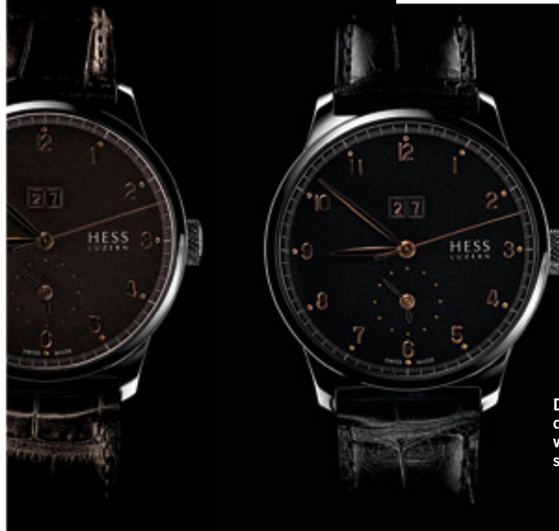
Das Zifferblatt der TWO.1 verändert seine Farbe.

Gute Freunde verlängern das Leben. Wer sich oft mit Freunden trifft, intensive Unterhaltungen führt und seine Erlebnisse mit anderen teilt, hat eine bis zu 22 Prozent höhere Lebenserwartung. Nicht die Anzahl der Freunde, sondern die Qualität der Freundschaft ist entscheidend, wie australische Forscher herausgefunden haben. Ihr Rat: Pflegen und vertiefen Sie Ihre Freundschaften.